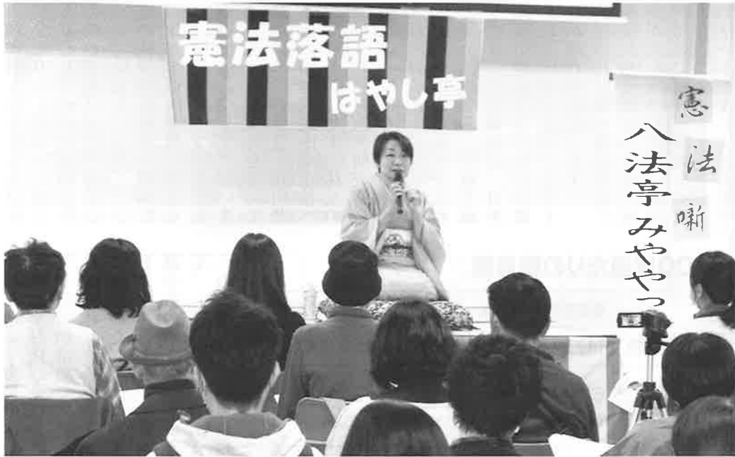
▲ユーモアあふれる語り口に参加者も引き込まれました