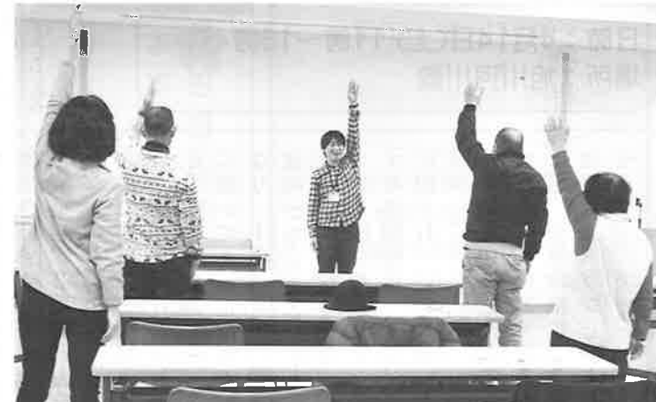
▲ゆっくり体を動かしてストレッチで心地よく

会場に入るとすぐに良い香りがしています。その香りだけで、日常とは違う空間、特別な気持ちになります。作業療法士からの自己紹介の後、自分の利き目がどちらかを探す作業、意識を呼吸に集中し「今の自分に向き合う」マインドフルネスなどを、部屋の明かりを消し、ゆったりと安心できる雰囲気の中で行っていました。また、音楽に合わせてゆっくりと体を動かし、筋肉の動きを意識し