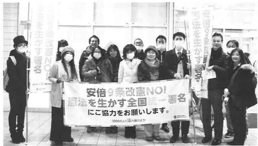
▲寒くても元気にみんなで行動

憲法学習会の終了後、「憲法を守るために行動しよう」との労働組合の呼びかけで、コープ東川原店の