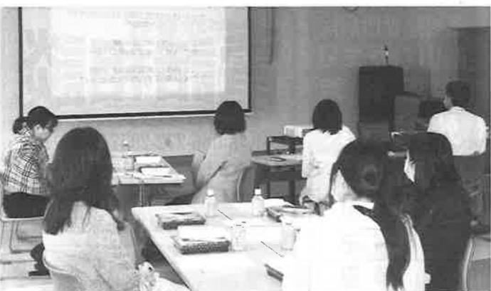
▲楽しく語った食事会

林病院が加盟している岡山県民主医療機関連合会では「憲法」を大切に考え、学習しています。医療や福祉の現場で働く者において、人権や生存権(社会保障)を学び、憲法の理念を理解して日々の仕事に活かしていく必要があります。目の前の患者さんの権利は保障されているのか、高齢になつたとき安心して生活できる保障になつてい