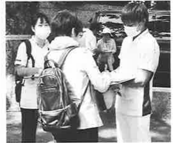
▲メーデー会場での署名活動

比べても遅れている日本の精神医療については知らない方も多いという印象でした。まだまだ私たちが旺盛に宣伝をしていく必要性を感じました。様々な場所で、少しでも多くの人が署名活動に参加することで、コソコソと署名は積み上がっていきます。今までに、