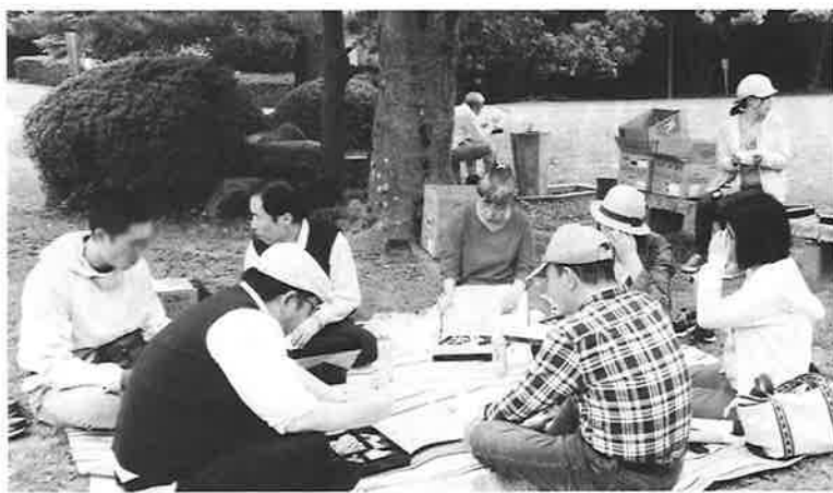
▲新緑の空間で美味しい空気と美味しいお弁当

5月16日にデイケアでは栄養科の特製手作り弁当を持参し玉野市の深山公園に利用者15名、職員4名の総勢19名で出掛けました。深山公園は玉野市のほぼ中央に位置する広大な公園で、園内には、道の駅、イギリス庭園、ミニパターゴルフ場、ドッグラン等；多くの施設があります。また、県内有数のサクラの名所としても知られています。当日は身体に優しい曇り空となり、絶好のドライブ日和でした。移動中の車内では、サービス精神旺盛な運転手さんと共に、市街地から田