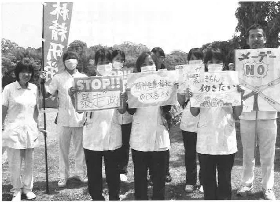
▲新入職員を中心に元気よくアピール

「精神保健医療福祉の改善を求める国会請願署名」の宣伝行動を、けやき外来とひだまり外来で行いました。外来での署名活動はあまり賑やかにはできませんので、チラシを作ってお一人ずつ説明をしながら署名の協力を依頼すると、快く応じていただけました。外来におられた会員さんからは、「もう少し署名用紙を送って欲しかった。近所の方にも頼めるからね。」と嬉しい声をかけていただきました。また、5月1日にはメーデー会場の石山公園でも、新入職員を中心に宣伝行動を行いました。署名に関しては気軽に協力して下さいましたが、諸外国と