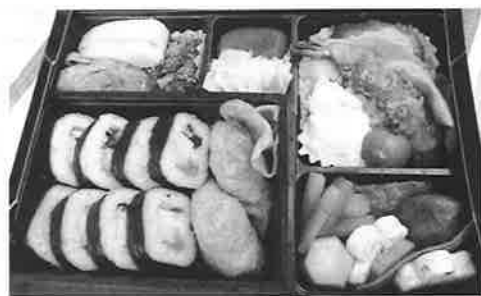
▲リクエスト通りの栄養科特製お弁当！

園風景へと変わる景色を楽しみました。到着すると、マイナスイオン充滿の新緑の世界です。思わず大きく深呼吸する人や、ありがと〜と森林浴セラピー癒される〜と大声でバンザイされる人が。癒しの空間を過ごしながら一番の楽しみである特製手作り弁当を頬張ります。その時です！虫の大群から予想外の大歓迎を受け、手で払いながらのランチタイムとなりました。これも大自然空間ならではの受け止めながら、無防備だった虫よけ対策を悔やみましたが、お弁当の美味しさで皆は笑顔に。あちらこちらから「うまい」「おいしい」の声。食後は周辺散策へ。園内の赤松池では、人慣れたコイやカメの出迎えに癒され、アヤメ、シヤクヤク、アジサイ、ワラビ等の植物を観察。時折、ネコも顔を出しにやってきました。次に、道の駅に移動し、お土産